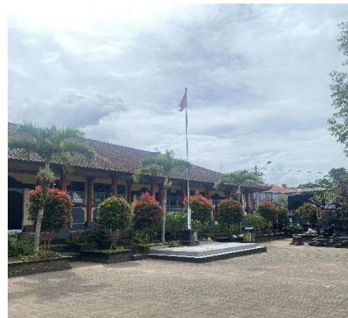
Lapangan Upacara SD 5 Pempatan