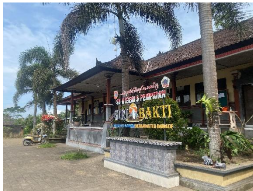
Tampak depan SD 5 Pempatan