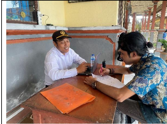
Wawancara dengan guru kelas 5