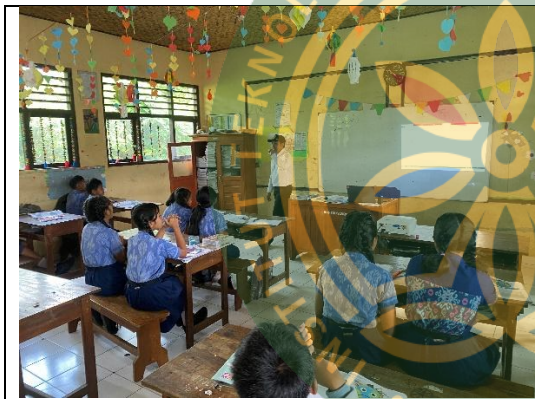
Kegiatan guru saat mengajar di kelas