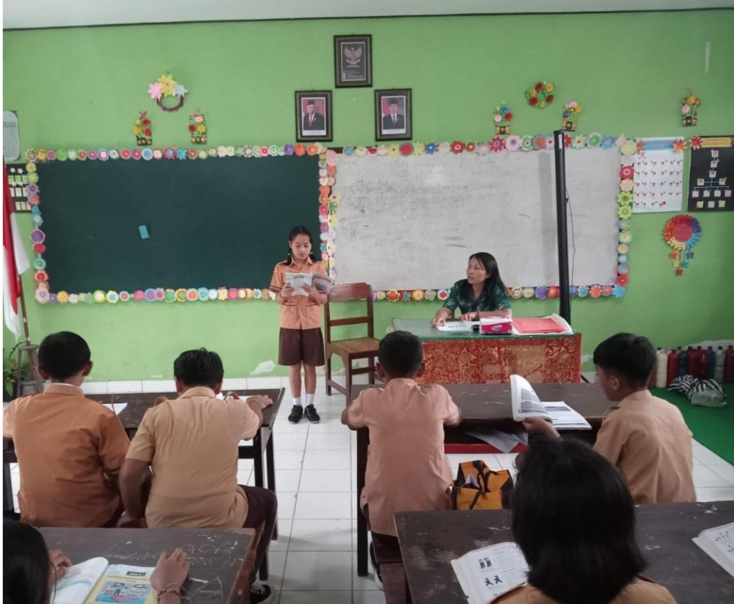
Gambar : Pelaksanaan Siklus 1