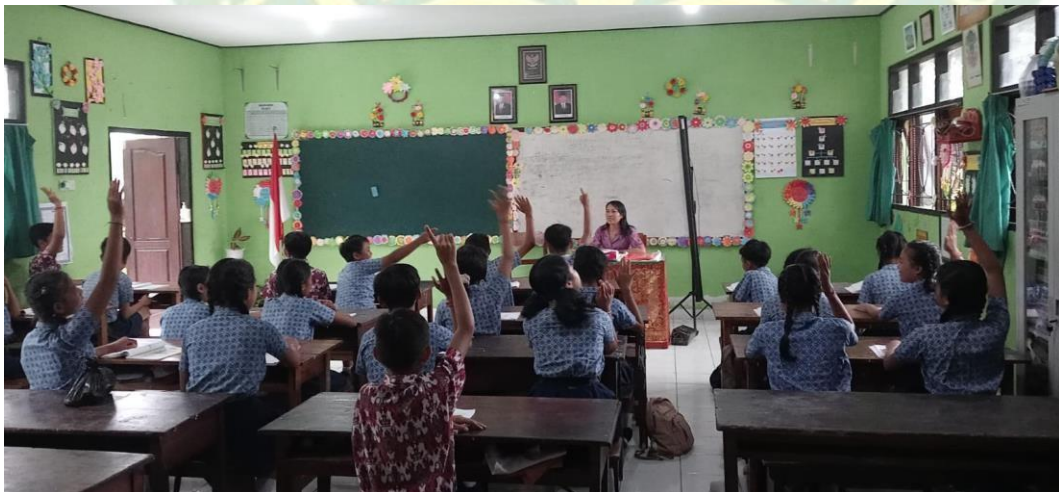
Gambar : Pelaksanaan Siklus 2