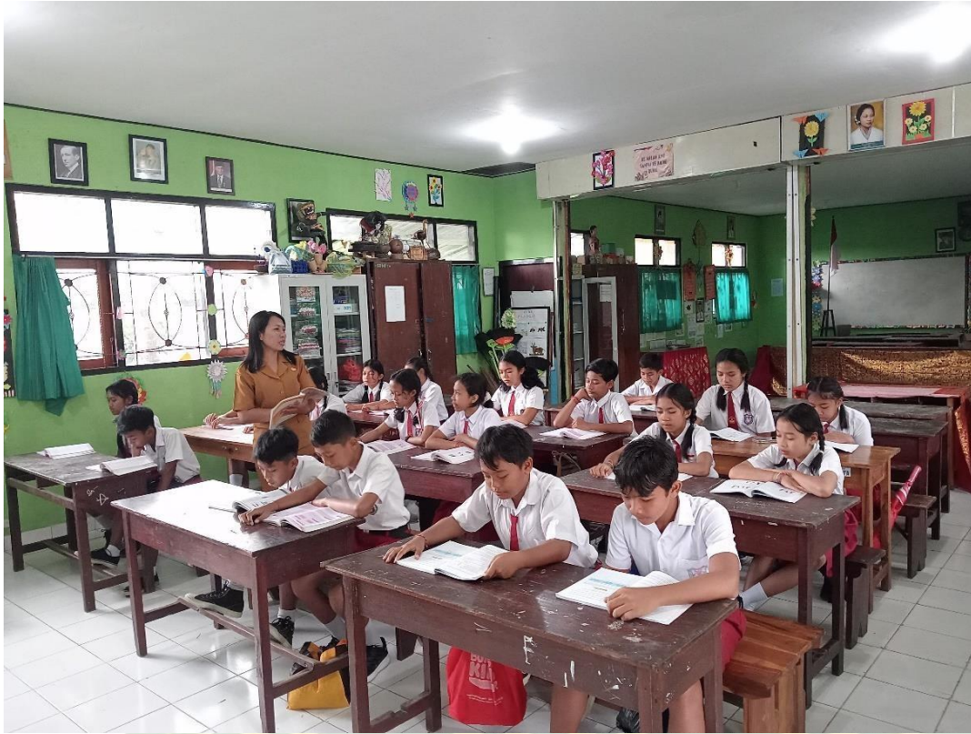
Gambar : Pelaksanaan Pra Siklus