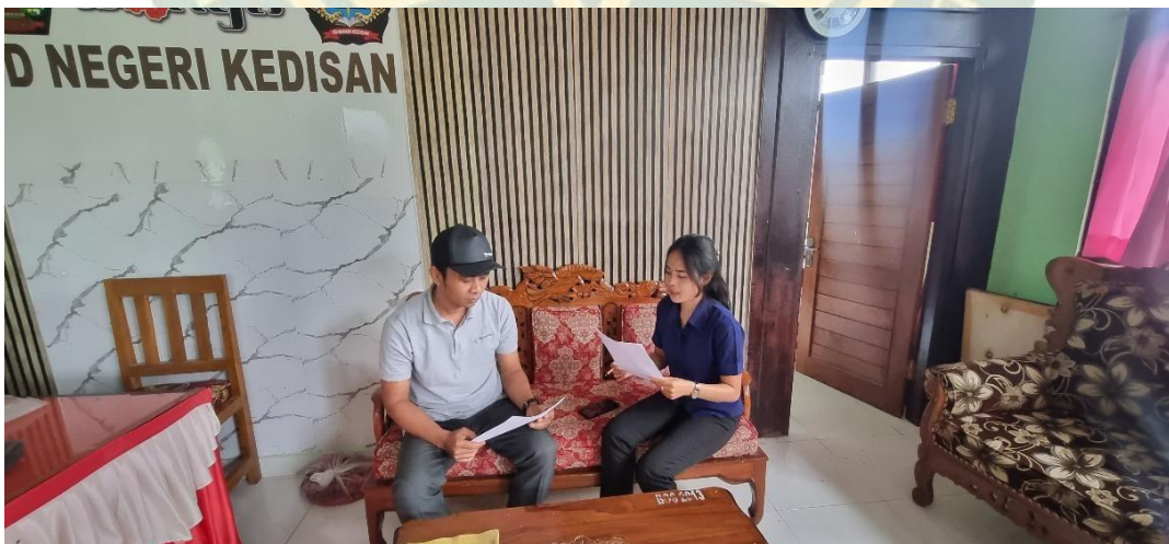
Wawancara dengan Guru/Pendamping Apel Pagi