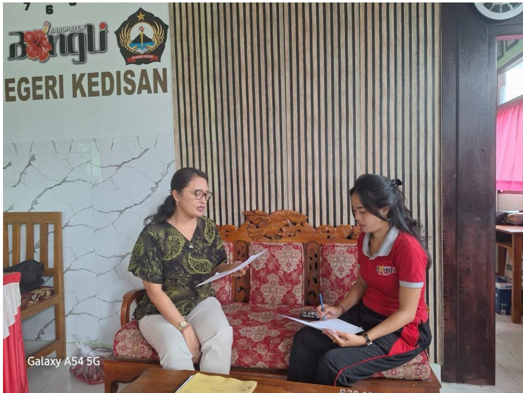
Wawancara dengan Kepala Sekolah SD Negeri Kedisan