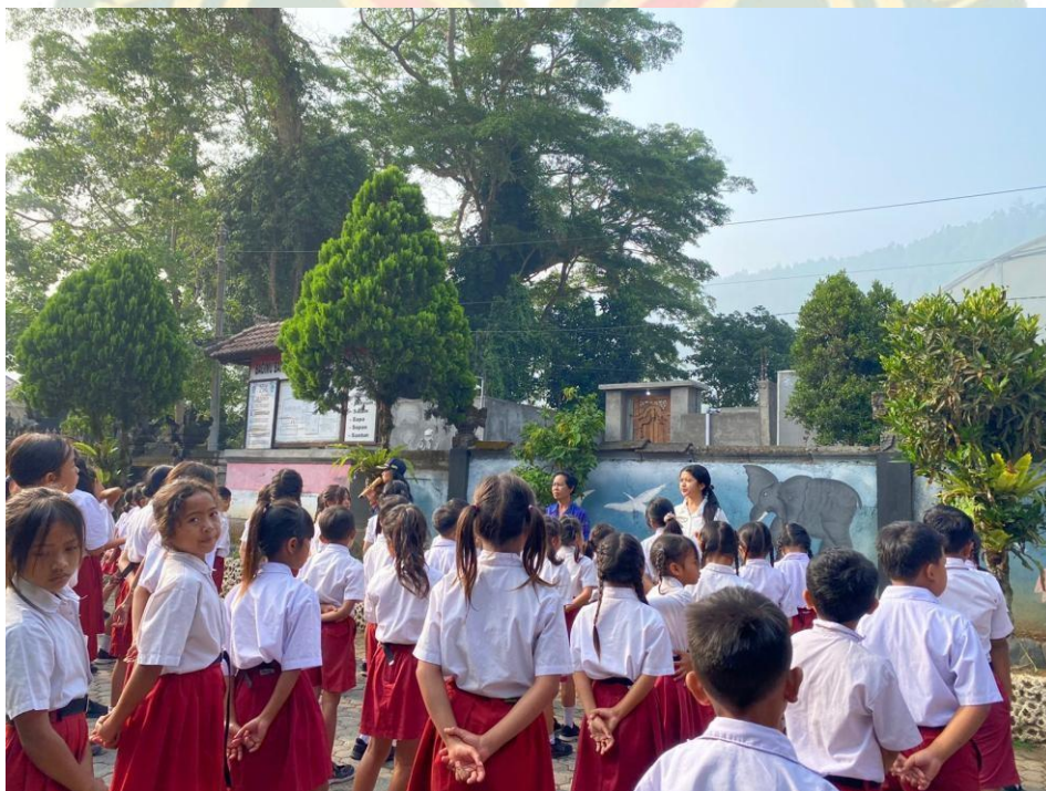
Kegiatan Apel Pagi di SD Negeri Kedisan