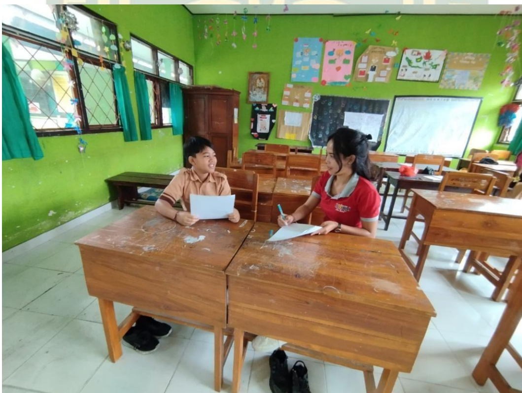
Wawancara dengan siswa SD Negeri Kedisan