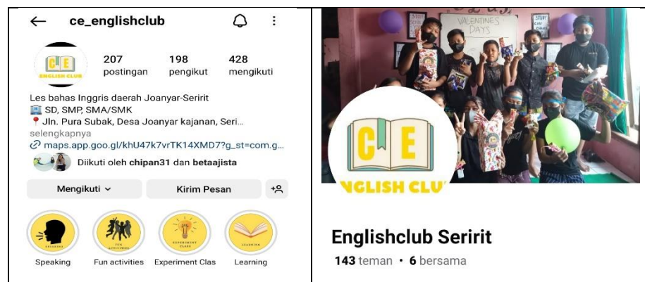
Gambar 4. 9 Media Sosial Ce_English Club

Promosi yang dilakukan baik berupa verbal maupun online melalui media sosial tentunya membawa hasil yang baik untuk kemajuan Ce_English Club karena memiliki banyak siswa, selain itu dapat menambah minat siswa dalam belajar Bahasa Inggris. Berdasarkan hasil observasi peneliti, mendapatkan bahwa selama peneliti melakukan observasi banyak siswa yang menghubungi untuk bergabung mengikuti pembelajaran Bahasa Inggris di Ce_english Club Joanyar. Seperti terlihat pada gambar, banyak siswa mendaftar mengikuti kursus.