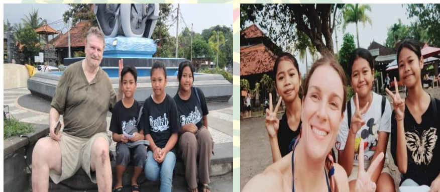
Gambar 4. 6 Pembelajaran Outdoor

Pembelajaran diluar lebih menekankan kemampuan belajar berbicara terutama kepada orang asing seperti bule, sering kali siswa diajak ke daerah wisata untuk bertanya kepada bule apa yang mereka ingin tanyakan seperti nama, asal, serta tempat tinggal kepada bule tersebut. Dengan kegiatan pembelajaran tersebut selain melatih pemahaman terkait materi, mereka juga diajarkan untuk berani untuk berbicara serta percaya diri. Sebagai contoh siswa diajak ke Pantai Lovina oleh Miss Chici dan merek menghampiri bule dan berinteraksi dengan baik dengan bule tersebut. Sehingga selain mereka belajar berbicara ( speaking ) dengan guru mereka juga bisa berbicara dengan native speaker atau orang yang memang fasih ber Bahasa Inggris dan Bahasa Inggris menjadi bahasa ibu mereka.