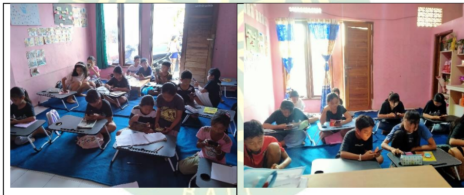
Gambar 4. 4 Pembelajaran Game Online