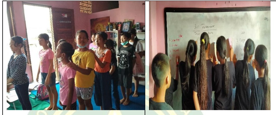
Gambar 4. 5 Pembelajaran fun learning dengan games offline

Permainan game offline ini dilakukan tanpa menggunakan koneksi internet yang bertujuan untuk membantu siswa belajar Bahasa Inggris secara aktif dan menyenangkan. Melalui aktivitas ini siswa dapat meningkatkan kemampuan berbicara ( speaing ), Mendengar ( listening ), membaca ( reading ), serta menulis ( writing ) dalam suasana yang santai dan interaktif.