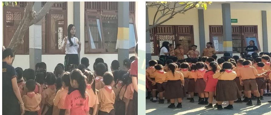
Gambar 4. 8 Promosi secara Verbal

teman sekolah maupun teman disekitar lingkungan rumahnya. Selain itu dilakukan pula promosi lewat disekolah, kebetulan pemilik kursus ini bekerja di Sekolah yaitu di SD Negeri 2 Joanyar, sehingga memudahkan untuk berbagi informasi terkait pendaftaran, harga dan juga kegiatan yang dilakukan di kursus ini sehingga siswa-siswi SD tahu dan minat untuk mengikuti kursus Bahasa Inggris ini.