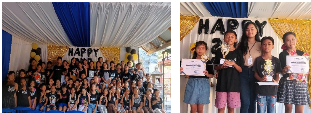
Gambar 4. 7 Kegiatan Anniversary