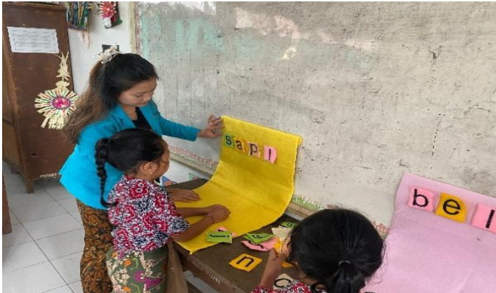
Pertemuan 1 memberikan bimbingan khusus pada peserta didik