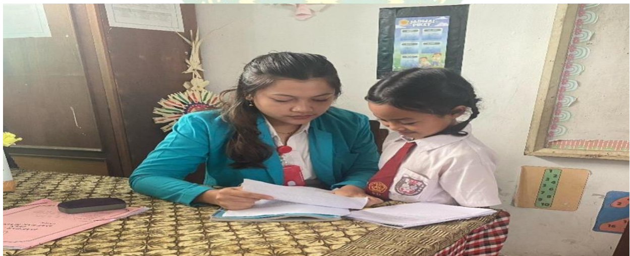
Test Siklus II Pelaksanaan Test Siklus 2