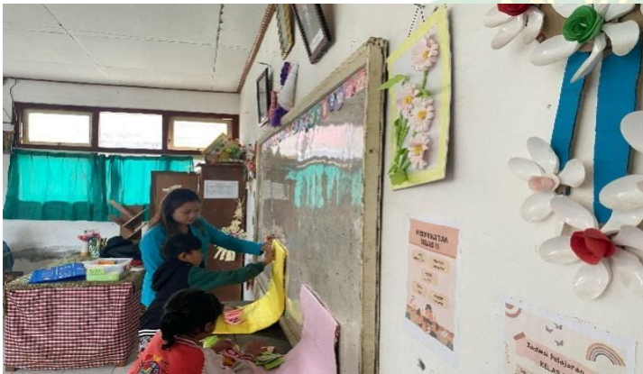
Pertemuan 2 pelaksanaan games peserta didik