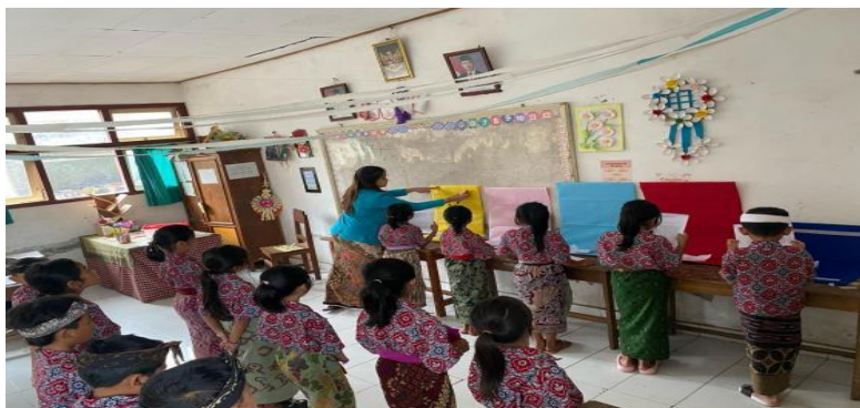
Pertemuan 1 menjelaskan materi pada peserta didik