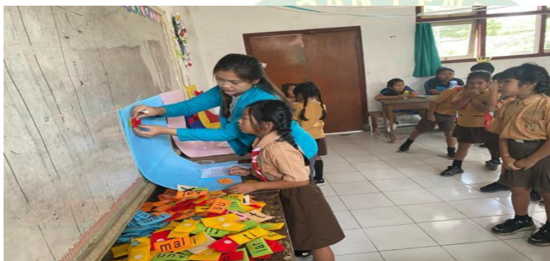
Pertemuan 2 Pelaksanaan games peserta didik