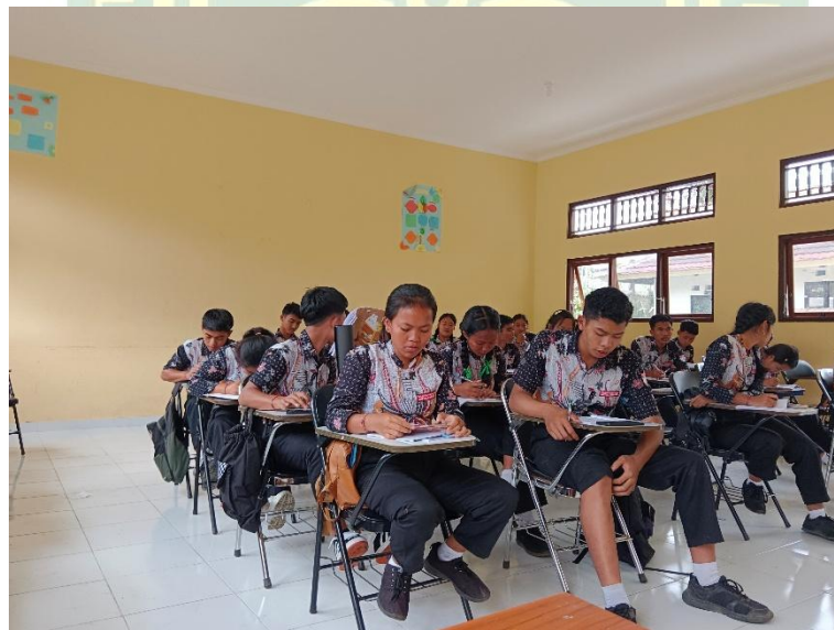
Siswa Kelas X Mengisi Kuesioner Terkait Kebutuhan Bahan Bacaan Literasi