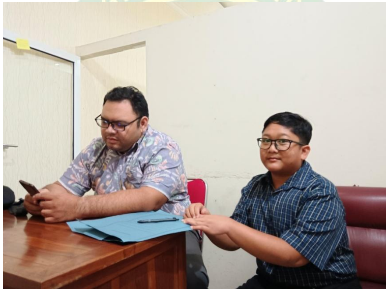
Validasi Ahli Isi Bahan Bacaan Literasi