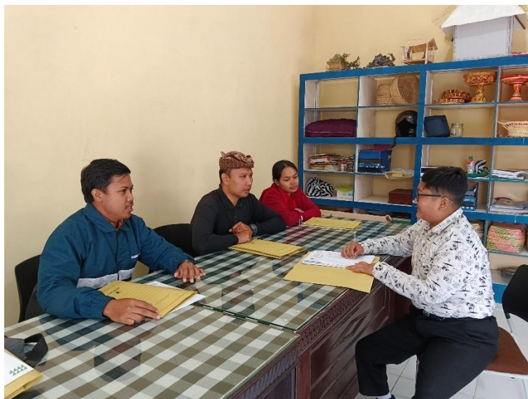
Kegiatan Wawancara Guru Terkait Kebutuhan Bahan Bacaan Literasi