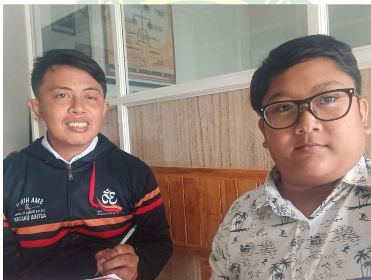
Kegiatan Wawancara Kepala Sekolah Terkait Kebutuhan Bahan Bacaan Literasi