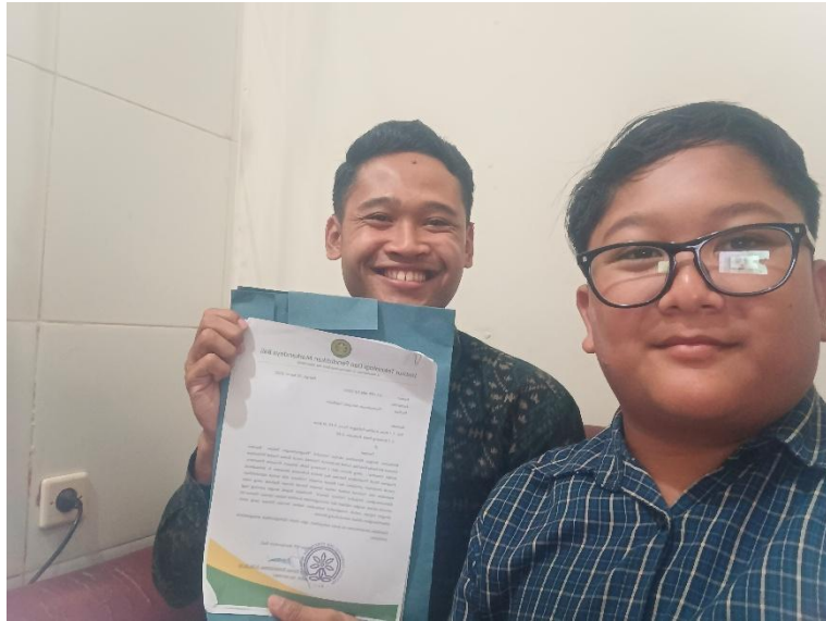
Validasi Ahli Isi Bahan Bacaan Literasi