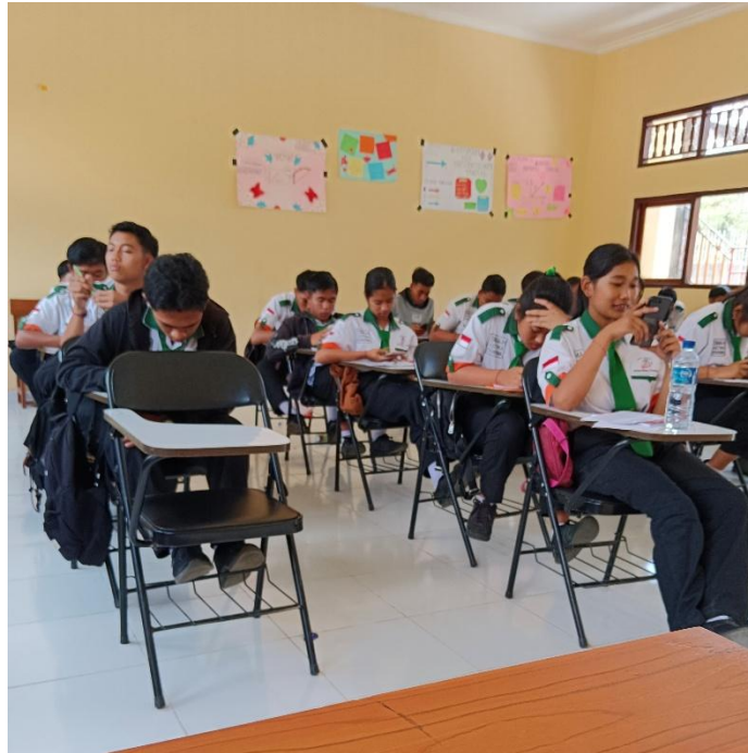
Siswa Kelas XII Mengisi Kuesioner Terkait Kebutuhan Bahan Bacaan Literasi