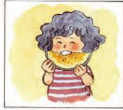
Maya suka buah melon.