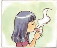
Mimi minum teh madu.

Pada kegiatan mengenali kalimat pernyataan, lakukan hal-hal sebagai berikut.