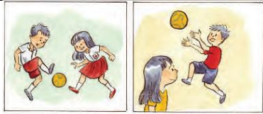
Mimi suka main bola.