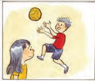
Baju Moko merah.